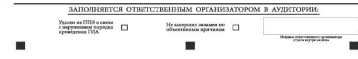
Рис. 6. Поле для отметок организатора в аудитории о фактах удаления участника экзамена из ППЭ либо о незавершении экзамена по объективным причинам

ВАЖНО!!! Одновременно два поля НЕ ЗАПОЛНЯЮТСЯ. Отметка ставится либо в поле «Удален из ППЭ в связи с нарушением порядка проведения ГИА», либо «Не завершил экзамен по объективным причинам».